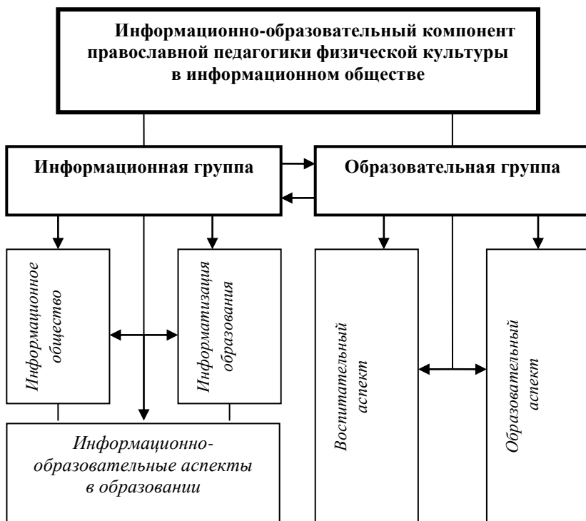
Рис. 3. Структура информационно-образовательного компонента православной педагогики физической культуры в информационном обществе

В ходе исследования информационно-образовательного компонента православной педагогики физической культуры в информационном обществе мы начали рассматривать научные работы ученых информационно-образовательного направления (исследования, посвященные изучению информационного общества; исследования, посвященные изучению информатизацию образования; исследования, посвященные изучению информационно-образовательных