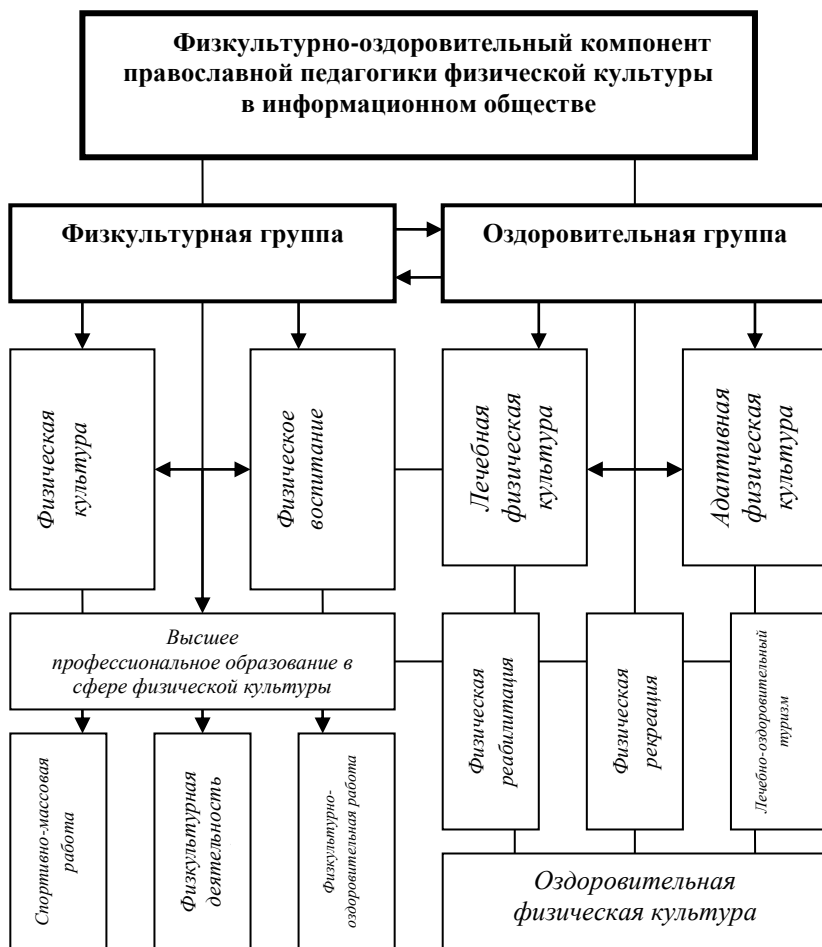
Рис. 2. Структура физкультурно-оздоровительного компонента православной педагогики физической культуры в информационном обществе

В процессе работы мы начали рассмотрение научных исследований физкультурно-оздоровительного направления (исследования, посвященные использованию средств физической культуры; исследования, посвященные